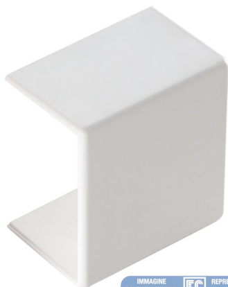
IMMAGINE RAPPRESENTATIVA REPRESENTATIVE IMAGE