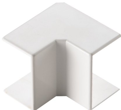
IMMAGINE RAPPRESENTATIVA REPRESENTATIVE IMAGE

Goulottes > Mur et plafond > Systèmes de moulures > Série mc-mca-ma - accessoires > Angle intérieur