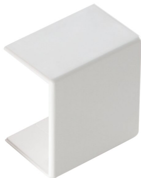
IMMAGINE RAPPRESENTATIVA REPRESENTATIVE IMAGE