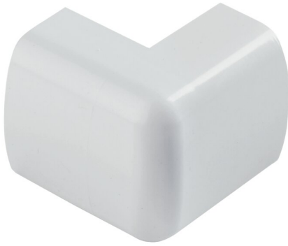
IMMAGINE RAPPRESENTATIVA REPRESENTATIVE IMAGE