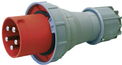
IMMAGINE RAPPRESENTATIVA REPRESENTATIVE IMAGE