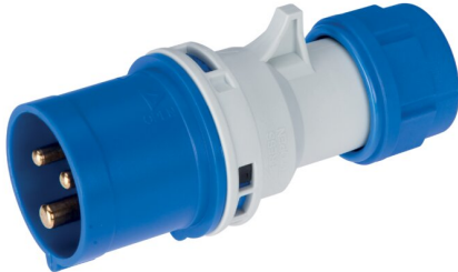
IMMAGINE RAPPRESENTATIVA REPRESENTATIVE IMAGE

Industriel > Fiches et prises > Prises et fiches mobiles > Fiches > Fiche cee (iec 60309) > Ip44 - 16 a