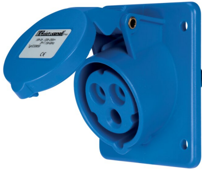
IMMAGINE RAPPRESENTATIVA REPRESENTATIVE IMAGE

Industriel > Fiches et prises > Prises et fiches mural > Prises > Prise à encastrer cee (iec 60309) > Ip44 - 16 a