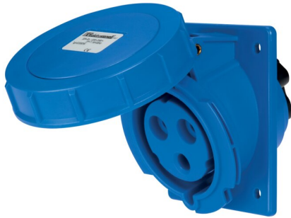
IMMAGINE RAPPRESENTATIVA EC REPRESENTATIVE IMAGE

Industriel > Fiches et prises > Prises et fiches mural > Prises > Prise à encastrer cee (iec 60309) > Ip67 - 16 a