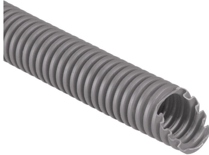
IMMAGINE RAPPRESENTATIVA REPRESENTATIVE IMAGE

Conduits et accessoires > Conduits > Tube flexible > SÉrie icta - pp - classe 34223 - 750 n > Tube plastique (installation électrique) > Gris