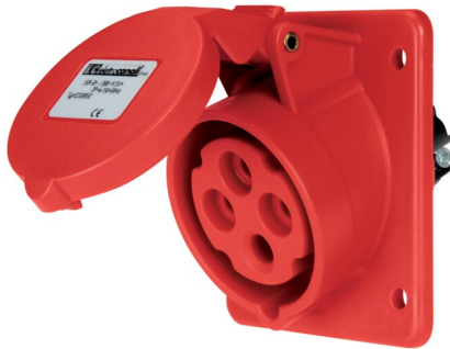
IMMAGINE RAPPRESENTATIVA REPRESENTATIVE IMAGE

Industriel > Fiches et prises > Prises et fiches mural > Prises > Prise à encastrer cee (iec 60309) > Ip44 - 32 a