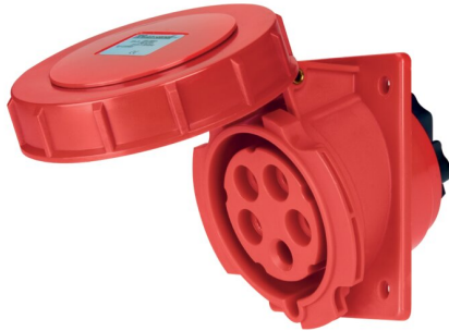
IMMAGINE RAPPRESENTATIVA EC REPRESENTATIVE IMAGE

Industriel > Fiches et prises > Prises et fiches mural > Prises > Prise à encastrer cee (iec 60309) > Ip67 - 32 a