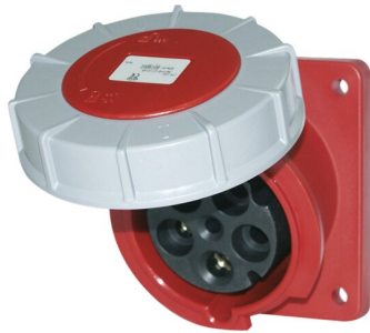
IMMAGINE RAPPRESENTATIVA REPRESENTATIVE IMAGE

Industriel > Fiches et prises > Prises et fiches mural > Prises > Prise à encastrer cee (iec 60309) > Ip67 - 63 a