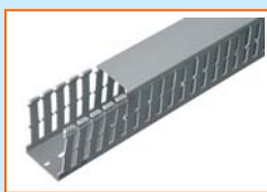
Goulotte type "A"