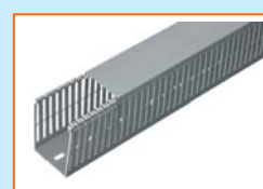
Goulotte type "S"

L'appareil de coupe code «ECADC» se compose d'une lame qui, actionnée par le levier supérieur, permet la coupe de goulottes, couvercles et produits similaires en matériel plastique. Il s'adapte à tous les types de goulotte de câblage EC 4/6/4 type "S" et 8/12/8 type "A" de 25 à 120 mm de largeur et jusqu'à 120 mm de hauteur.